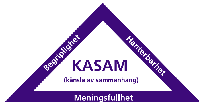
Begriplighet, hanterbarhet och meningsfullhet är enligt Aaron Antonovsky de tre faktorer som skapar KASAM – känsla av sammanhang.

Aaron Antonovsky fann att begriplighet, hanterbarhet och meningsfullhet relaterar till varandra och är nödvändiga hörnstenar för det som gör att vi klarar svåra situationer bättre. Han sammanfattar detta i begreppet KASAM – känsla av sammanhang (figur 1).